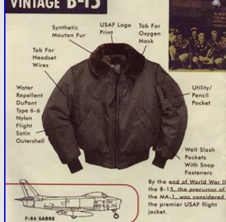
Bomber B-15 Vintage Made in USA